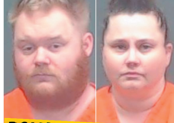
POLICE LINE DO NOT CROSS