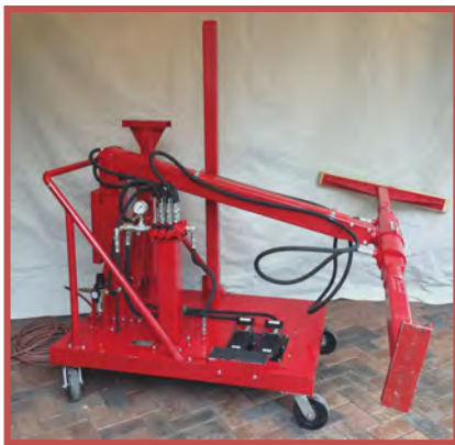
CONTREP™ Modelo R-04

CONTREP es el UNICO sistema de reparación de contenedores en existencia que es capaz de realinear marcos de puerta que estén fuera de alineamiento; ¡una gran innovación en la industria de reparar contenedores!