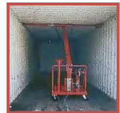
Pared Superior (Incl. Top-Rail)